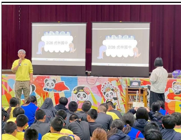
115年2月26日- 安全性教育講座