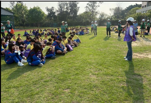
115年3月31日- 全校教職員及學生防災演練