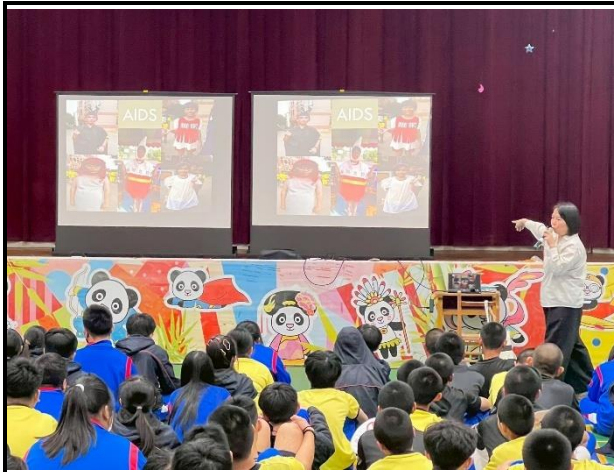
115年2月26日- 安全性教育講座