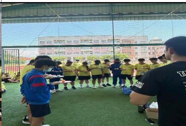
115.5.29安全教育盃十項全能挑戰賽