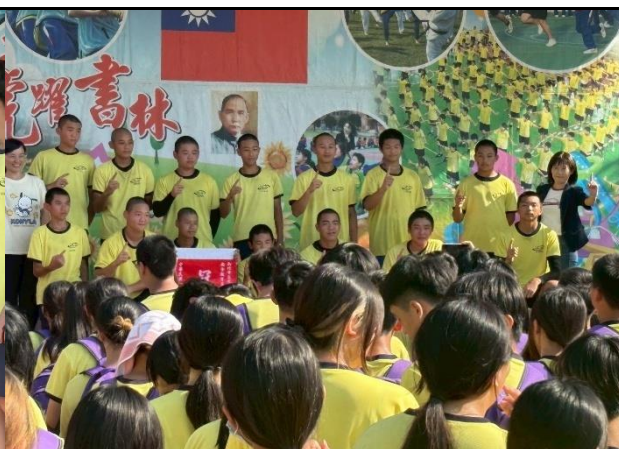
115.5.29安全教育盃十項全能挑戰賽