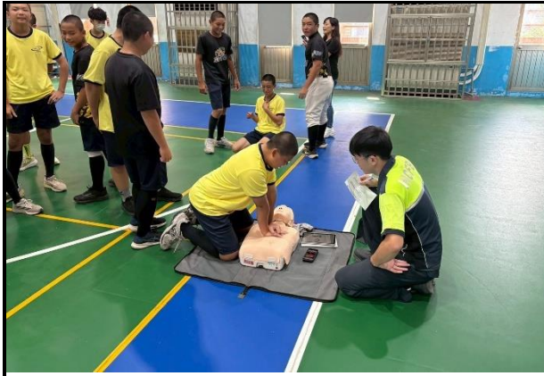
114年9月11日- 竹光消防局安全急救教訓練