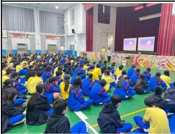
115年2月26日- 安全性教育講座