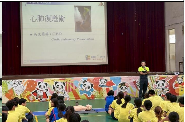
114年9月11日- 竹光消防局安全急救教訓練