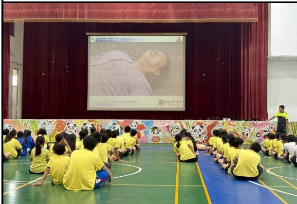
114年9月11日- 竹光消防局安全急救教訓練