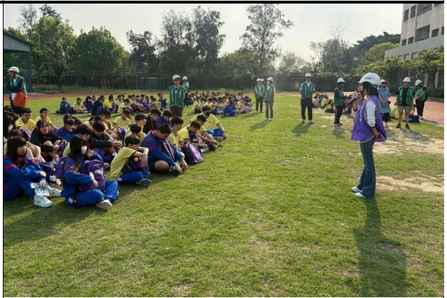
115年3月31日- 全校教職員及學生防災演練