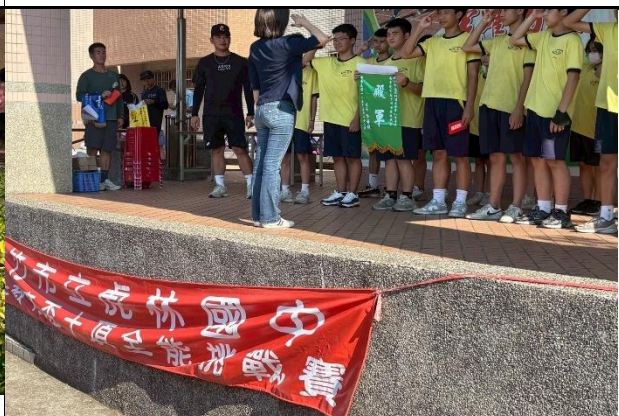
115.5.29安全教育盃十項全能挑戰賽