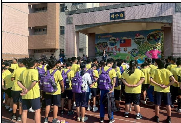
115.5.29安全教育盃十項全能挑戰賽