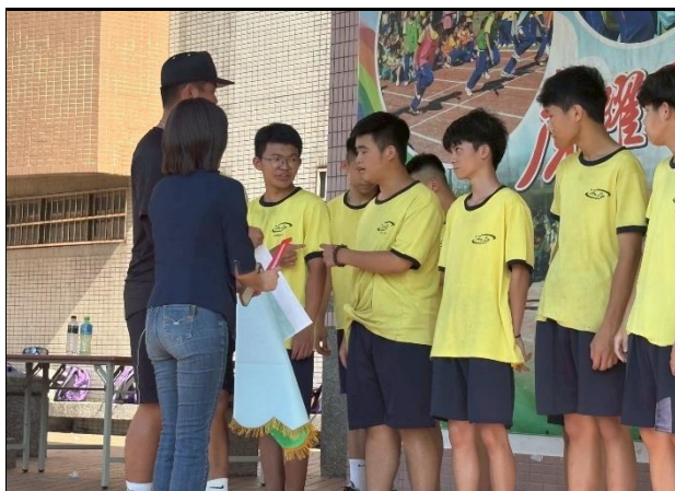
115.5.29安全教育盃十項全能挑戰賽