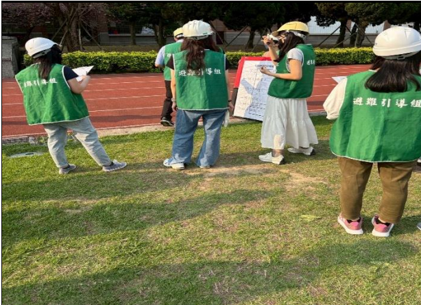
115年3月31日- 全校教職員及學生防災演練