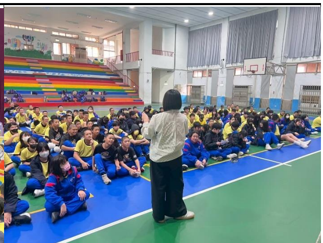
115年2月26日- 安全性教育講座