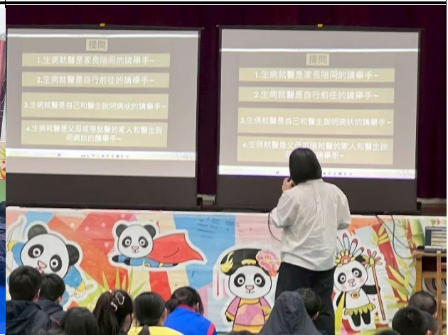
115年2月26日- 安全性教育講座