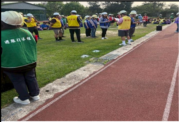
115年3月31日- 全校教職員及學生防災演練