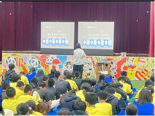
115年2月26日- 安全性教育講座