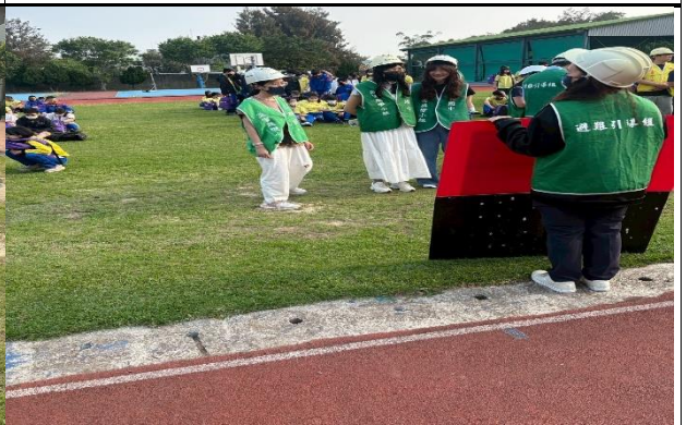
115年3月31日- 全校教職員及學生防災演練