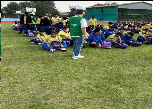
115年3月31日- 全校教職員及學生防災演練