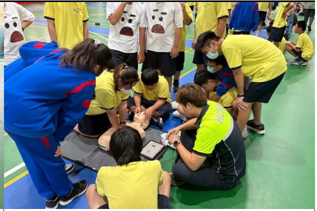
114年9月11日- 竹光消防局安全急救教訓練