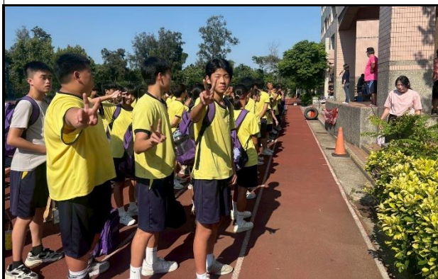
115.5.29安全教育盃十項全能挑戰賽