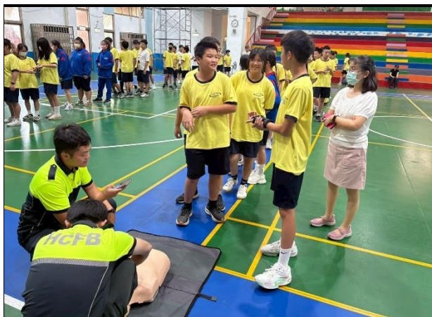
114年9月11日- 竹光消防局安全急救教訓練