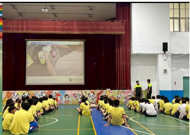
114年9月11日- 竹光消防局安全急救教訓練